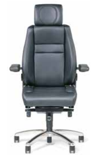
BMA Secur24 Exclusive

Rufen Sie uns einfach unter +49 211 310 610-0 an oder senden Sie uns Ihre Anfrage online: www.bma-ergonomics.com/de/teststuhl-anfordern