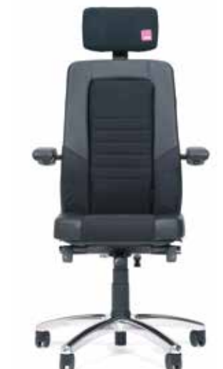
Axia® Focus 24/7