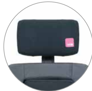
Schutzüberzug mit Logo