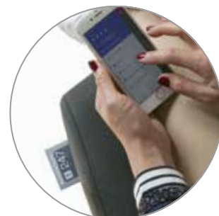
Axia Smart Active