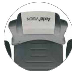
Schutzüberzug für die Kopfstütze