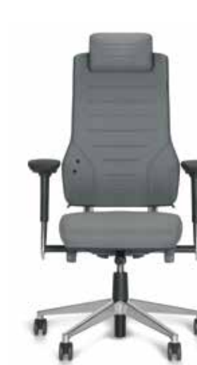
Axia® Vision 24/7

ÜBERZEUGEN SIE SICH SELBST! FORDERN SIE IHR WUNSCHMODELL ONLINE ODER TELEFONISCH AN: