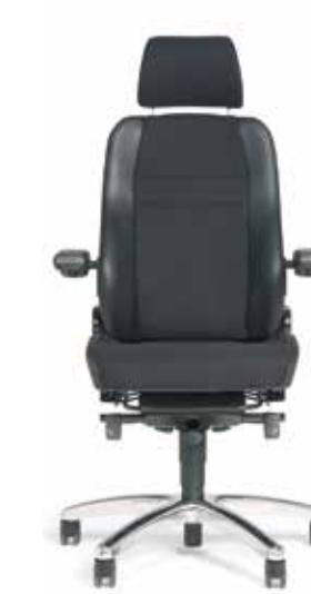
BMA Secur24 Basic