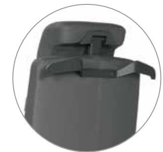
Kopfstütze und Kleiderbügel

lässt sich auf Wunsch mit folgendem Zubehör erweitern: