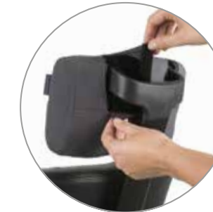
Schutzhülle mit Logo

lässt sich auf Wunsch mit folgendem Zubehör erweitern: